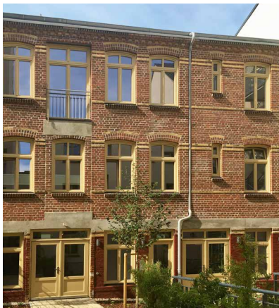
DAS HIPS IN DER HAMBURGER KAROLINENSTRASSE